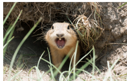
Sisler og klippeegern lever ofte i grupper, og skal så vidt muligt holdes flere sammen. Artsfæller kommunikerer blandt andet ved forskellige vokaliseringer.