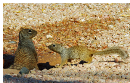
Hos Rocky Mountain klippeegern parrer gruppens dominerende han sig med flere hunner. Forud for en parring jager han ofte hunnen rundt.