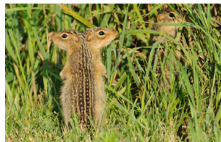
Trettenstribet sisel er hurtig på jorden men klatrer og springer også godt, hvorfor de også bør have klatremuligheder.

Flere arter lever naturligt i mere tørre områder, hvor der ofte ikke er vand tilgængeligt, og væskebehovet er derfor ikke stort. I fangenskab skal der dog altid være frisk vand tilgængeligt enten i flaske (med tud i gnavesikret materiale, dvs. ikke aluminium) eller en fast skål, så de kan drikke efter behov.