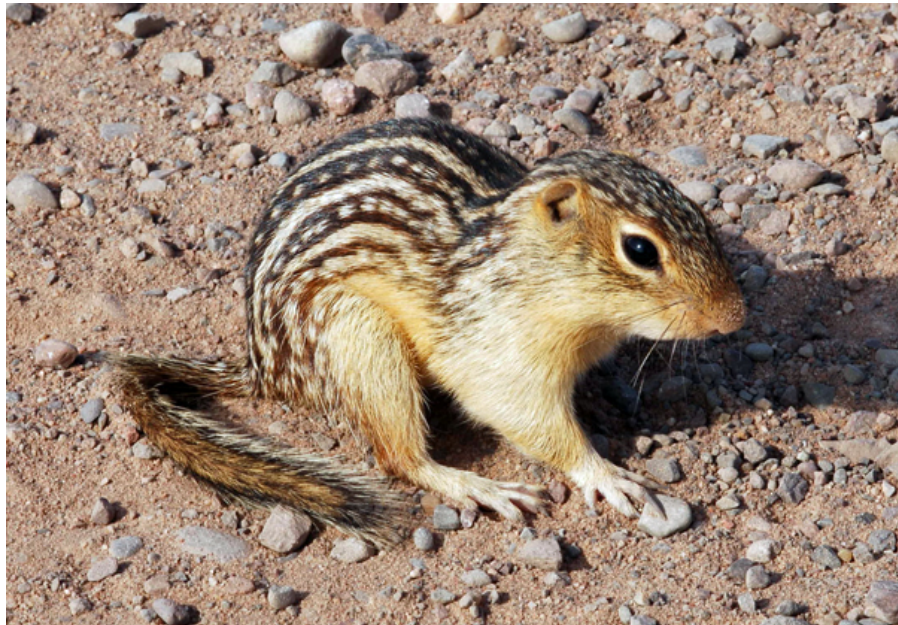
Trettenstribet sisel ( Spermophilus tridecemlineatus ) er den mindste af sislerne og kendes ved de karakteristiske rygstriber.