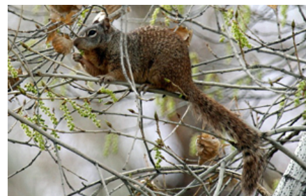
Sisler skal have et dybt, stabilt bundlag af jord, hvor de kan grave underjordiske gange og huler. Hos især Richardsons sisel må dybden gerne være over 1 m. Klippeegern er dygtige klatrere og skal have rigeligt klatremuligheder i anlægget.