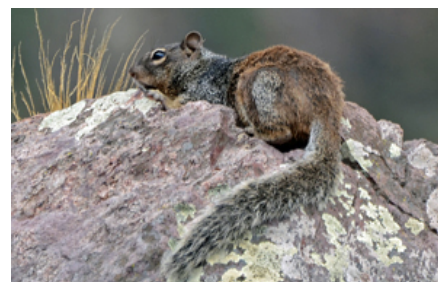
Fra øverst: Europæisk sisel, Richardsons sisel og Rocky Mountain klippeegern. Sislers små ører gør, at jord bedst muligt forhindres i at komme ind i øregangen ved gravning, mens klippeegernets lange hale bruges som balanceorgan, når de klatrer rundt.