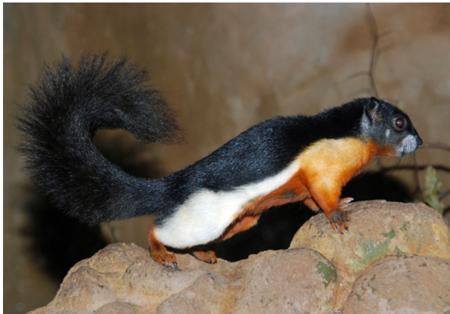
Nogle pragtegern er meget flotte i farverne, og Prevosts pragtegern ( Callosciurus prevostii ) siges at være et af de mest farverige pattedyr.