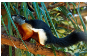
Prevosts/trefarvet pragteger ( C. prevostii ).