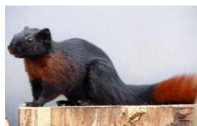
Finlaysons pragtegn ( C. finlaysonii ferrugineus ).