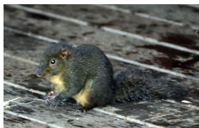
Gyldenbuget pragteger ( Dremomys pernyi ).