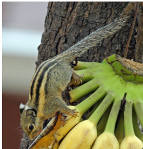
Himalaya sribet eger ( Tamiops maccllellandii ).