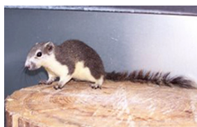
Finlaysons pragtegn ( C. finlaysonii ).