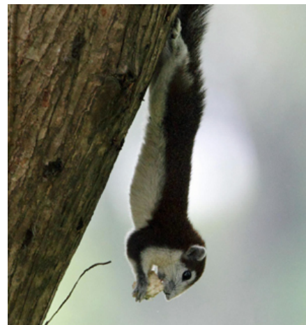
Pragteger er dygtige klatrere og skal holdes i rummelige volierer med rigeligt klatre- og springmuligheder.

C. prevostii , som naturligt kun lever i tropisk klima og er tilpasset hertil, skal dog om vinteren holdes indendørs i et let opvarmet rum, men kan holdes udendørs om