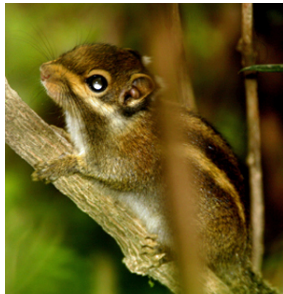
Swinhoei's sribede eger ( T. swinhoei ).