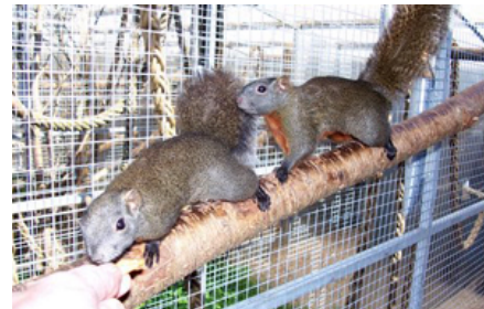
Pragtegern kan med jævnlig og tålmodig trænes til at blive tamme. Træning kan være en stimulerende aktivitet for dyrene og desuden en fordel for begge parter ved sundhedstjek og eventuel håndtering. Direkte håndtering bør dog kun ske hvis helt nødvendig, da dyrene let stresses heraf. De kan desuden bide relativt hårdt i forsvar.

Grene og gerne en gnavesten skal altid være tilgængeligt som gnavemateriale, og en saltsten og mineralblok skal også gives. Vitamintilskud gives i pulverform i passende mængde (afhængigt af produktet) strøet ud over foderet.