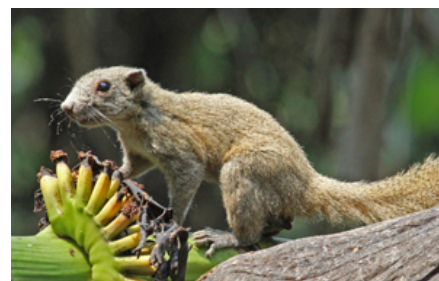
Pragtegern æder både vegetabilsk og animalsk føde. Det er vigtigt med et alsidigt foder bestående af forskelligt tørfoder, hvirvelløse dyr, frugt og grønt. Prevosts pragtegern og de sribede egern skal desuden tilbydes akaciegummi.