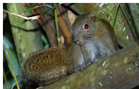
Gråbuget pragtegn ( Callosciurus caniceps ).