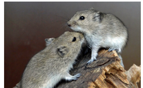
Lemminger (her Brandts steppemus) lever naturligt i grupper og skal altid holdes flere sammen, helst i grupper på 3-8 individer. Det er lettest at holde kuldsøskende eller individer, der er sammensat som helt unge. Især hanner kan være aggressive over for hinanden.

Moeras lemming, der kommer fra et mere fugtigt miljø, hvor planteføden ofte er meget grøn, producerer ekskrementer med en meget stærk grøn farve. Denne karakteristiske afføring bruges til at identificere artens tilstedeværelse i et givent område i naturen.