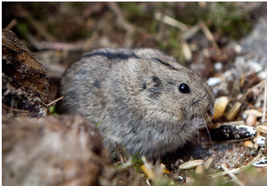
Lemminger er tæt beslægtede med blandt andet markmus og mosegris. Steppelemming ( Lagurus lagurus ), som her på billedet, er den lemming-art, der hyppigst ses i privat hold i Danmark.