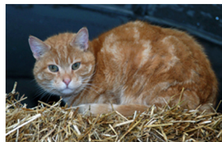
Tamkatten findes i mange forskellige fremavlede racer/varianter, der kan variere i størrelse, pelstype og farve/mønster. Vildkattens pels er kort og grålig med mørke striber.

Katte findes i dag i det meste af verden grundet introduktioner, primært som skadedyrskontrol. Især hvor naturlige fjender og konkurrenter mangler, er katten en invasiv art, der truer det oprindelige dyreliv, bl.a. unikke fuglearter.