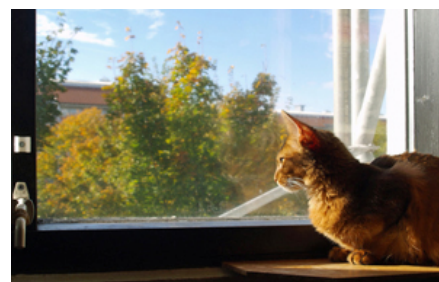
Det mest optimale for katten er, når den har en fast indendørs base med frisk foder og vand tilgængeligt, og samtidig har fri adgang til udearealer væk fra trafikerede veje. På den måde har katten de bedste muligheder for at udfolde naturlig adfærd. Indekatter kræver berigende aktiviteter, der kan stimulere dem. De skal desuden have masser af fri plads i højden, hvor de kan hvile sig på og holde udkig fra, f.eks. vindueskarme og kattetræer.