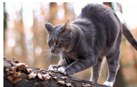
Katte krads i forskellige objekter for at hvæsse kløerne og for at markere territoriet. Udendørs findes naturlige objekter at krads i, mens der indendørs skal være et kradsbræt/-træ, evt. beklædt med sisal. Derudover skal indekatte have adgang til kattegræs eller kattermalt.

Katte vil bruge en del tid på at hvile eller sove, måske i over halvdelen af døgnet. Dette skyldes ikke et lavt naturligt behov for motion, men grunder i at de instinktivt sparer på energien for at kunne udføre en fysisk krævende jagt, der i naturen er livsvigtig for at skaffe tilstrækkelig føde. Vildkatten ses at jage over distancer på 3-10 km hver nat. Trods mangeårig avl er tamkattens fysiologi stort set identisk med