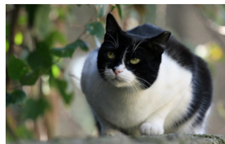
Katte er rovdyr, og det er helt naturligt for dem at jage. Udekatte har rig mulighed for at udføre denne naturlige adfærd, mens indekattes jagtinstinkt skal stimuleres ved forskelligt legetøj. Sørg for at udskifte legetøjet jævnligt, da de ellers hurtigt mister interessen for det.

Dyrlægen kan hjælpe med mærkning og registrering.