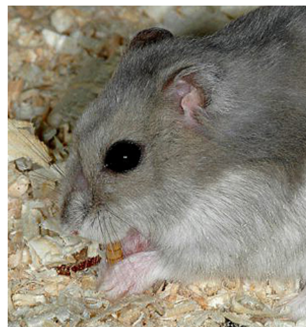
Dværghamstere spiser både planter og smådyr, og det er derfor vigtigt at give dem bl.a. insekter og orme, foruden en god færdigblanding til hamstere og lidt grønt.

Campells og vinterhvid dværghamster yngler normalt første gang i 3-6-månedersalderen, er drægtige i 18-21 dage og får normalt 4-6 unger. Roborovski dværghamster yngler som regel første gang i en lidt senere alder, men fortsætter til gengæld med at yngle i længere tid, er drægtig i 23-30 dage og føder normalt 3-5 unger. Dværghamstere kan blive drægtige igen meget kort tid efter fødslen, men man bør vente mindst et par måneder og helst længere, før de parres igen.