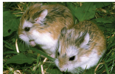
Dværghamstere, der sættes sammen som unge, kan i velindrettede og rummelige anlæg ofte trives fint sammen. Er pladsen for lille og mangler skjul kan de dog blive meget aggressive over for hinanden. Hold altid øje med, om de trives sammen. Kan de kun holdes for sig selv, kan to bure stilles ved siden af hinanden, og evt. kan de sættes sammen på neutral grund. På billedet ses Roborovski dværghamster.