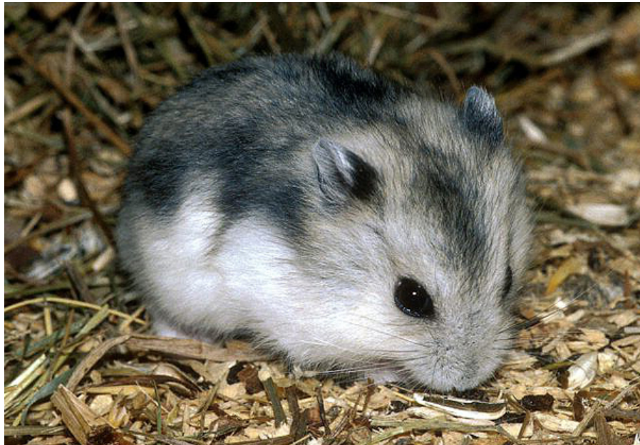
Vinterhvid dværghamster ( Phodopus sungorus ) er én af de tre ægte dværghamster-arter, der holdes i fangenskab.