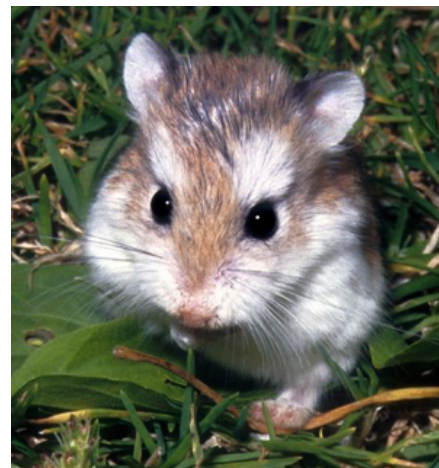
Roborovski dværghamster.