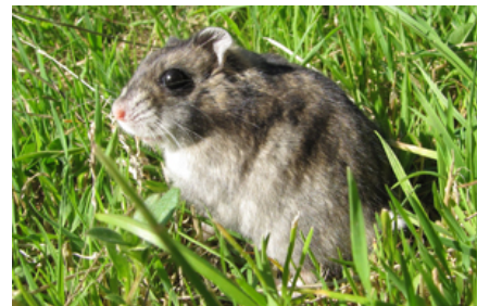
For at give dværghamstere mere motion og nye undersøgelsesmuligheder kan tamme individer tages ud i f.eks. en løbegård, hvor det er let at holde øje med dem og sikre, at de ikke undslipper. Husk dog på at dværghamstere graver godt!

Selvom hamstervat findes i handlen, kan hamstere risikere at vikles ind i det, miste lemmer og kvæles.